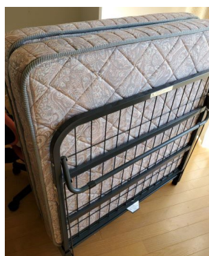
ベッドマット 閉じた状態