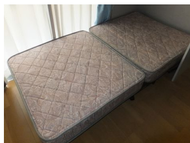
ベッドマット 開いた状態